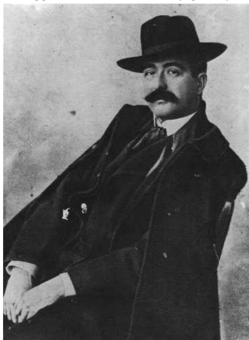
Figura 1 - Pietro Gori

Alcuni mesi dopo, durante la scrittura dell'articolo sui mulini bibbonesi, mi sono imbattuto nuovamente in lui leggendo il testo di una epigrafe posta sui resti dell'antico mulino della Madonna alle porte di Bibbona.